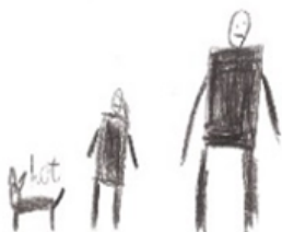
Olek, lat 6

Dzieci często, aby poradzić sobie z uczuciami robią rysunki. Czasami w zabawach pokazują swoje emocje. Rzadziej o nich mówią.