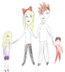
Ania, lat 8